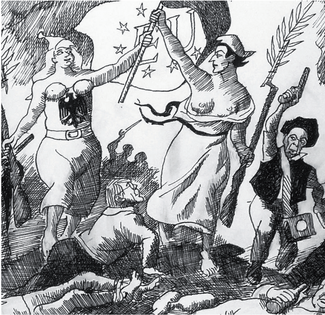
Zeichnung von Ernst Maria Lang. © Ernst Maria Lang, 1995. Alle Rechte vorbehalten.

mit Arbeiten von Klaus Stuttmann und Plantu