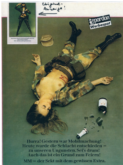
Abb. 6 : J.P. Jansen, Pardon-Werbespot, pardon N° 1, 1971. 21 (cf. également Planche couleur XI)

Der im Vergleich zu Hara-Kiri spürbar schwächere werbekritische Impuls macht sich in den 60er Jahren nicht zuletzt an dem Fehlen fast jeglicher Form schwarzen Humors bemerkbar. Dies ändert sich in Ansätzen erst zu Beginn der 70er Jahre, als die Werbung selbst kühner zu werden beginnt und pardon mit einer neuen Rubrik aufwartet, die sich nunmehr wie bei Hara-Kiri am Konzept der Verfremdung realer Anzeigen orientiert. Zwischen 1971 und 1973 erscheint eine Serie mit dem Titel « Pardon-Werbespot », die explizit Bezug auf reale Werbeanzeigen nimmt und diese auch mit ins Bild setzt. Die m.E. deutlichste dieser Parodien nimmt den Sexismus und Militarismus einer Sekt-Firma aufs Korn, wobei jedoch die Originalwerbung in ihrer unfassbaren Dummheit nach einer solchen satirischen Verarbeitung förmlich zu rufen scheint.