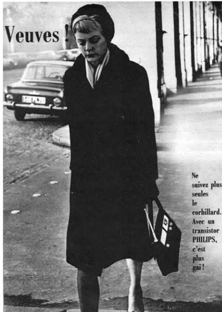
Abb. 2 : Hara-Kiri , N° 42. 9

Der Gesichtsausdruck lässt keinen Schluß auf die Gemütsverfassung der Dame zu. Sie ist in elegantes Schwarz gekleidet und trägt eine ebensolche Handtasche, die von Hara-Kiri mittels einiger graphischer Retuschen in ein Transistorradio der Marke Philips umgewandelt wurde. Der Bildausschnitt ist so gewählt, dass eine eindeutige Zuordnung dieses Gangs nicht möglich ist. Der Hintergrund mit dem Säulengang eines städtischen Gebäudes, durch den andere Menschen hindurchgehen, sowie eine Reihe geparkter Autos, lassen auf das erwähnte urbane Umfeld schließen. Dass wir es hier mit einem Leichenzug zu tun haben, erscheint keinesfalls naheliegend, wird jedoch durch den dazugehörigen Text suggeriert, wobei die Autoren kulturelle Merkmale eines solchen traurigen Anlasses, wie schwarze Kleidung und den gesenkten Blick, die im vorliegenden Photo zufällig gegeben sind, für ihre Konstruktion nutzen. Der Betrachter kann sich also auf diese Fiktion hier durchaus einlassen,