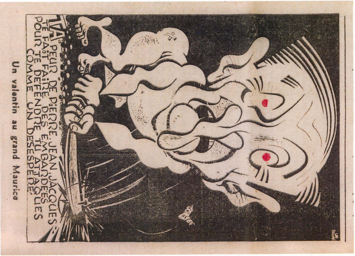
Figure 1. « Un valentin au grand Maurice », Vrai , 22 février 1958, p. 1. Avec l'aimable autorisation de la Fondation Robert LaPalme, Montréal.