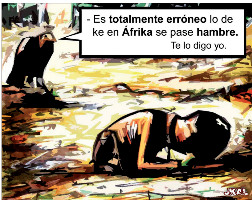
Fig. 4 : « Hambre en África ».

En référence possible aux témoignages d'enfants abandonnés par leurs mères sur les routes 3 , la figure 4 représente le corps d'un enfant recroquevillé sur un sol aride. Les contours flous et la taille disproportionnée de ses membres rendent compte des carences alimentaires que lui, tout comme une masse d'anonymes, ont subies au cours des derniers mois. En arrière-plan de l'image, un vautour déclare ironiquement à l'attention du public : « Il est totalement faux qu'on crève de faim en Afrique. C'est moi qui vous le dis ! ».