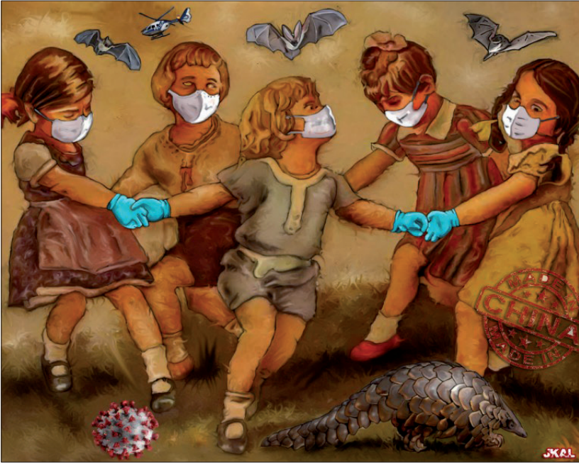
Fig. 9 : « Juego de niñas ».

Publiée lors de l'assouplissement des mesures de confinement (jusqu'en mai, les autorités espagnoles empêchaient les citoyens de sortir, ne serait-ce que pour une heure), l'image montre une ronde de petites filles qui rappelle le tableau « Der Kinderreigen » de Hans Thoma ou « L'Enterrement de la sardine » de Francisco de Goya, à la différence près que les enfants ne portent pas un masque de Carnaval mais chirurgical. Malgré la possibilité de retourner au parc et de jouer entre elles, les petites doivent rester vigilantes : la danse du pangolin et des chauves-souris « made in China » rappellent la permanence du danger.