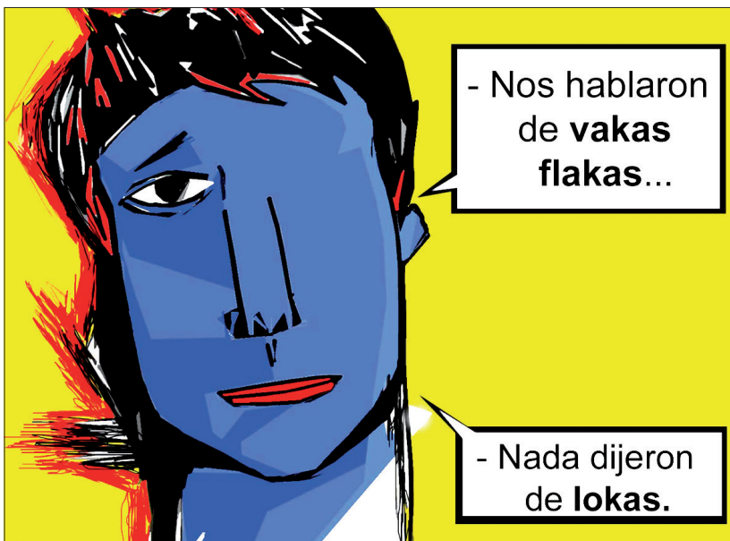
Fig. 1 : JKAL, « Vakas lokas », 2001.

La figure 1 est un exemple du style qui permettra à l'artiste (signant ici sous le nom de JKAL) de se faire un nom dans la presse. Le dessin, aux couleurs vives, montre un personnage au visage bleu et allongé, et privé d'un œil. Comme dans la plupart des dessins de JKAL, l'effet comique repose sur la confrontation entre l'image et le texte, généralement inséré dans des bulles de dialogue rectangulaires. Ici, la figure bleue s'étonne : « On nous a parlé de vaches maigres... mais on ne nous a jamais dit qu'elles étaient folles ». Anti-conventionnel, JKAL recourt à une orthographe qui rejette la lettre C pour la remplacer par la lettre K, coquetterie héritée de son époque punk.