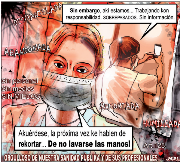
Fig. 7 : « La privada mata ».

Le texte inséré dans les bulles précise toutefois que le personnel soignant n'abdique pas : « Et pourtant, nous sommes là, à travailler de manière responsable, dépassés, sans information ». Puis il interpelle ironiquement le lecteur en parodiant les consignes relatives aux gestes barrières : « La prochaine fois qu'on vous parlera de coupes budgétaires, ne vous en lavez pas les mains ! ». La mention à l'article 128 de la Constitution, qui stipule que toutes les ressources de l'État espagnol doivent être subordonnées à l'intérêt général, tout comme le miroir, qui fait écho à la conscience humaine, renforcent ce discours militant.