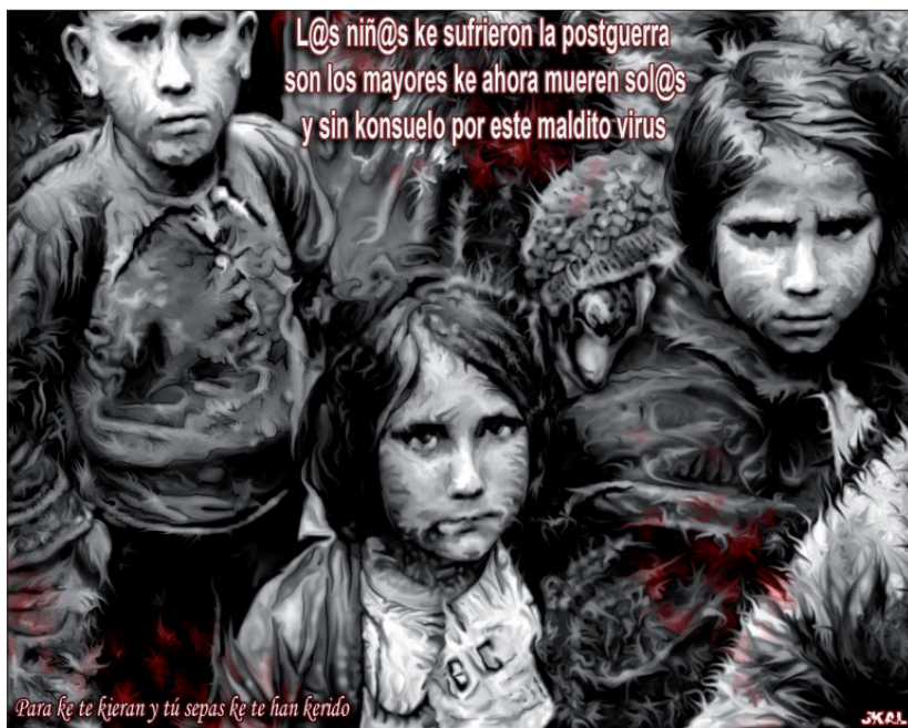
Fig. 8 : « Niñ@s de la postguerra ». Source : Una auxiliar... , p. 50.

Durant les cinquante jours de confinement, de multiples thèmes sont abordés par le couple : la situation des femmes battues ou des prisonniers, les conséquences économiques de la pandémie, l'usurpation par les forces de l'ordre des applaudissements dédiés aux soignants (chaque soir à 20h, des patrouilles défilaient dans la rue, gyrophares et sirènes allumés, pour se joindre au chœur) ou la couverture sensationnaliste des événements par la presse sont par exemple passés au crible de la critique. Parallèlement, Kalvelido expérimentera de nouveaux styles, comme l'illustre la figure 9, où l'on observe des enfants masqués faisant la ronde.